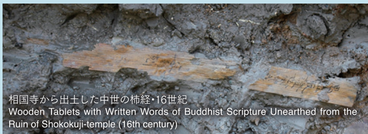
相国寺から出土した中世の柿経・16世紀 Wooden Tablets with Written Words of Buddhist Scripture Unearthed from the Ruin of Shokokuji-temple (16th century)