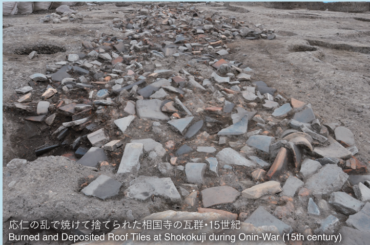
応仁の乱で焼けて捨てられた相国寺の瓦群・15世紀 Burned and Deposited Roof Tiles at Shokokuji during Onin-War (15th century)