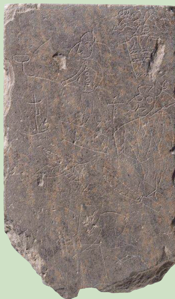
南蛮寺跡から出土した宣教師 線刻硯(17世紀初頭) Inkstone Engraved the Images of European Missionaries, Unearthed at the Ruin of Catholic Chapel in Kyoto (early 17th century)