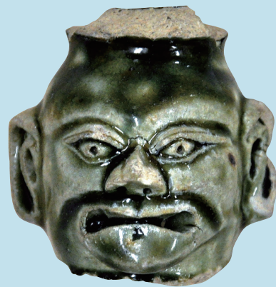
織部焼南蛮人燭台頭部 16世紀末 Oribe Ceramic of Candlestick Designed as European Person (the end of 16th century)