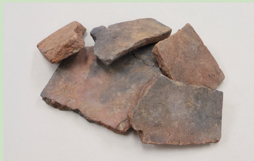
本能寺の変(16世紀後半)の 際に焼けた瓦群(京都市所蔵) Burned Roof tiles at 'The Incident at Honnoji' (16th century)