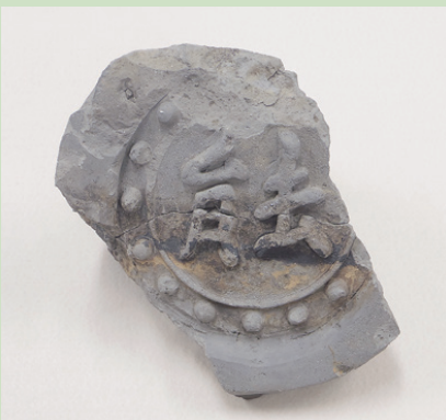
本能寺の「餠」字瓦と鬼瓦(京都市所蔵) Character designed Roof tile and Demon Tile in Medieval Honnoji Temple